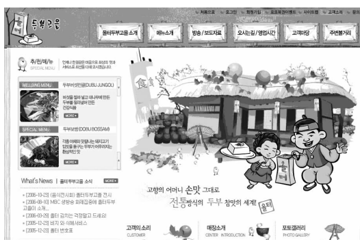
图 1-2 充实而不繁杂的页面效果