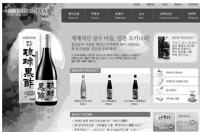
图 1-5 整齐的画面效果

条理与反复在很多较为优秀的网站中运用较多,应用得也比较自如。这是由于很多网站信息含量大,不得不运用一定的方式将其条理化,同时又在一定程度上加以归纳后重复地利用,使网页较为整齐,脉络清楚。图 1-5 所示为整齐的画面效果。