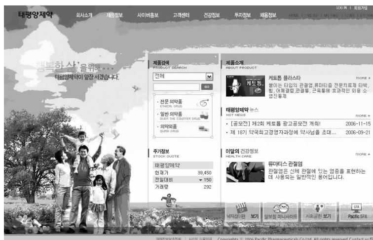
图 1-6 网页中的颜色调和

那么在网页设计中,如何利用它来达到好的效果呢?首先合理利用对比的因素,例如文本的排布,字体的大小、粗细、颜色,图片的宽窄、比例的反差、透明以及位置的放置等,图 1-6 所示为网页中的颜色调和。