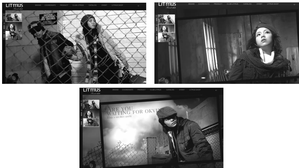
图 1-9 节奏感强烈的连续网页作品

在具体的网页设计运用中,网页元素的编排就经常会遇到这个问题,做得好的网页能够使排在一起的诸多元素富有音乐般的美感,同时丝毫不损其实用性。节奏感强烈的连续网页作品如图 1-9 所示。