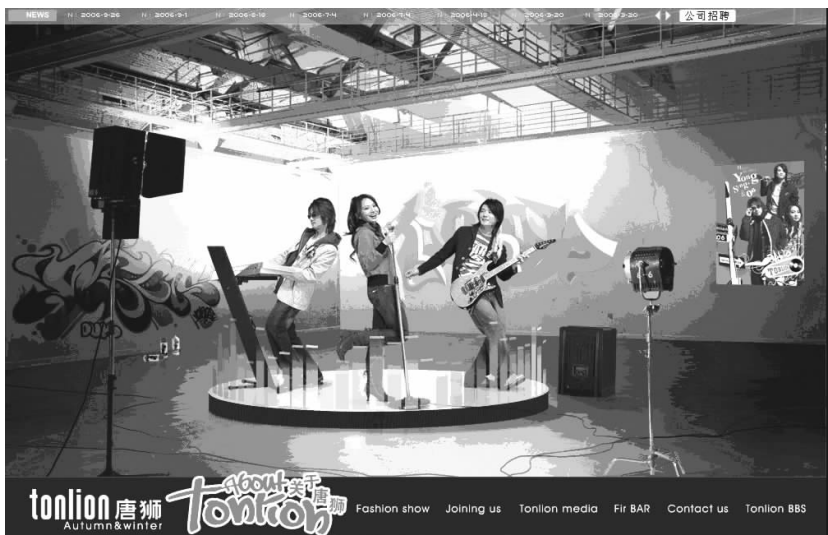
图 1-14 唐狮休闲服饰的网站页面

图 1-14 所示为唐狮休闲服饰的网站页面,最主要的特点就是在色彩的把握上拿捏得非常准确,对比强烈而不失柔和,使人在视觉上感觉特别贴切。