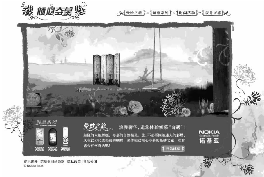
图 1-3 诺基亚商业广告页面

因此,在设计网页时,除了兼顾网页功能上的需要,还需要有针对性地采用一些美的形式,使网页做得更加有生气,更吸引人。这种美的形式有很多种,合理地利用,可以使网页增光添彩,赏心悦目;使受众浏览起来更加有效率,有力地提升网站的形象。图 1-3 所示为诺基亚商业广告页面。