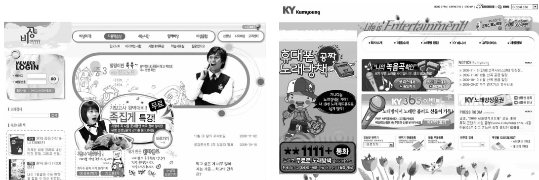
图 1-10 部分优秀网页作品

作为一名合格的网页设计师,除了要熟悉网页制作中的诸多要素,还需要站在网站本身的高点上来考虑。应综合自身的整体形象,如网站的标志、标准字体、标准色等,将这些经独特设计的关于自身经营理念的东西融合到网页设计中去,使这些方面体现得与众不同,才能创作出优秀的设计作品,如图 1-10 所示。