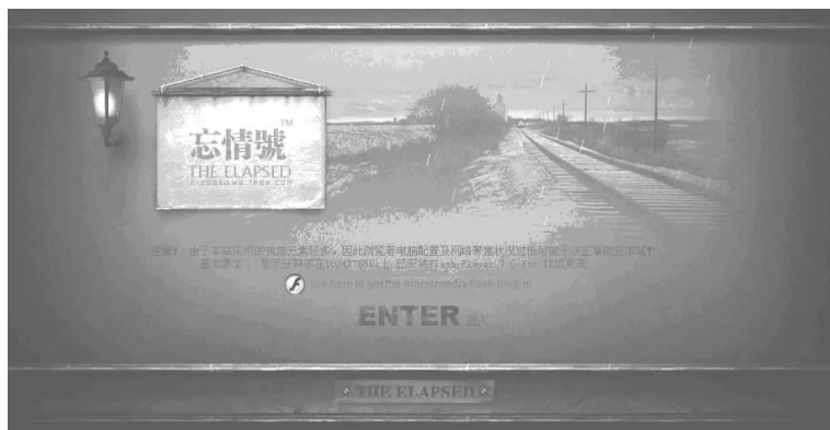
图 1-13 视觉效果与速度的矛盾

图 1-13 所示网站整体上给人一种陈旧、忧伤的感觉,尤其是首页,采用了大量的设计元素,视觉效果非常惹眼。不过在速度上就不敢恭维了,毕竟网页设计出来是供人欣赏的,如果速度太慢,肯定会极大地降低浏览者的兴趣。