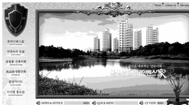
图 1-7 网页中的平衡

页面上的平衡是一个动态的平衡,只有通过不断地实践才能够在这方面驾轻就熟地运用,满足人们视觉上的整体的平衡感,这也是人的心理因素的一种图形化的表现,但不是一种片面地追求静止的对称,那是僵硬的、不生動的,同样会失去美感。网页中的平衡如图 1-7 所示。