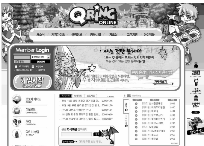
图 1-4 杂而不乱的游戏网站