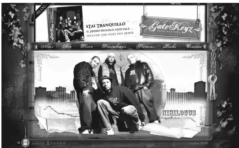
图 1-15 国外某音乐网站页面

图 1-15 所示为国外的一个音乐网站页面,总体感觉上与唐狮休闲服饰的网站页面有点雷同,都是倚重浓厚的色彩搭配来吸引眼球,同时利用左右两边的暗色调进行搭配,起到很好的互补作用。