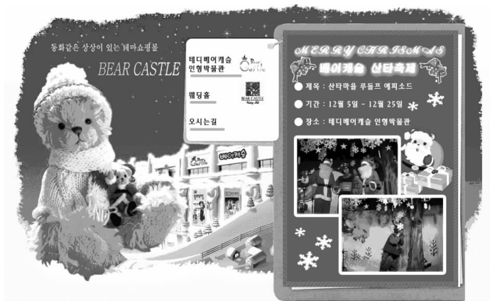
图 1-8 四周留空的网页效果

关于网页上的留空,并非要把整个页面塞满了才不觉得空,只要合理地安排,使页面达到平衡,即使在一边的部分大面积留空,也不会让人感到空;相反这样会给人留下广阔的思考空间,令人回味。四周留空的网页效果如图 1-8 所示。