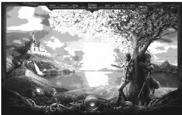
图 1-12 国外某游戏网站

图 1-12 所示为国外某游戏网站界面,整个页面给人一种如梦如幻的感觉。尤其是在色彩表现上,采用了插画的表达形式,构成了非常唯美的画面。最后加上超强烈的金属边框效果,不得不说是网页设计中的经典作品。